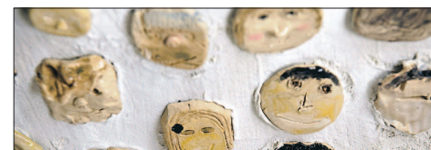
I BÅDEN ladet med liv, der er udformet som en gravid kvinde er indersiden dekoreret med portrætter udført af eleverne på Bjergby-Mygdal Skole. I den endelige version skal båden fyldes med portrætter samlet ind undervejs.