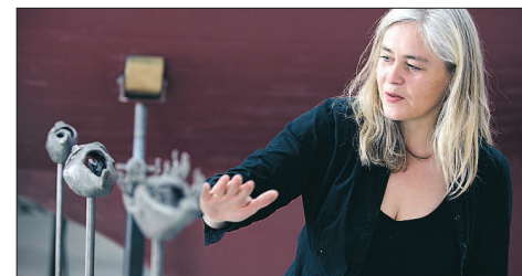
DE FØRSTE udgaver af båden er udført i bronze i størrelsesforholdet 1:40.