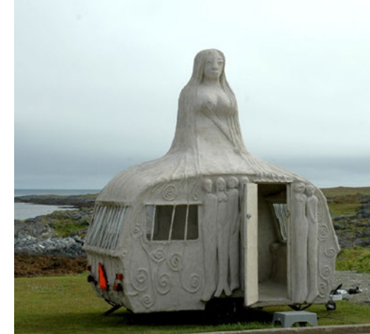
Nederst th. Sirenen Til Kirkedage i Aalborg Maj 2013