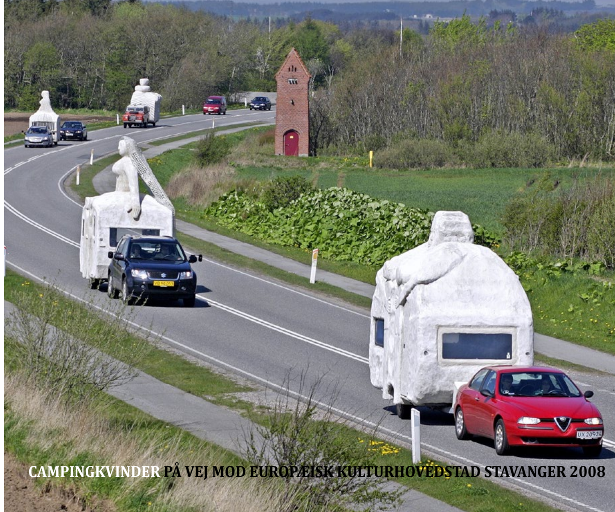
CAMPINGKVINDER PÅ VEJ MOD EUROPÆISK KULTURHOVEDSTAD STAVANGER 2008

Flytningekvinden læner sig forover og skuer frem mod en ukendt verden. Hun viser mod og styrke, men er også ængstelig og sårbar for hun ved jo ikke noget om den skæbne, der venter hende. Det indre i campingvognen er dækket af porcelænsmosaikker, der er skabt af 400 børn fra Stavanger-regionen i samarbejde med flytningekvinder i Sandnes. Mosaikkerne udtrykker savn og længsel. Den berømte palæstinensiske nationaldigter Mahmoud Darwish gav