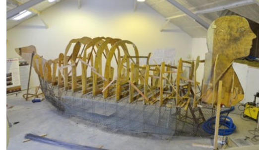
Fotomontage af Life-boats modeller i 1:5

De tre "sejlende kvinder" har hver især deres særegne personlighed og individuelle skæbne. De titler eller "navne", som de har fået, peger på et centralt punkt i deres skæbneforløb. De har fået følgende "navne": 1. Mit skib er ladet med Længsel . 2. Mit skib er ladet med Liv .