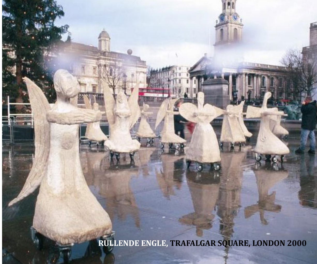
RULLENDE ENGLE, TRAFALGAR SQUARE, LONDON 2000

Denne installation er også en af de første af Marit Benthe Norheims skulpturinstallationer, hvor dialogen mellem det skulpturelle formsprog og musikken har en central plads. Englene tilhører ikke alene kristendommen eller andre religioner, men optræder også som symboler for vigtige livsværdier og indgår i personlige sammen-