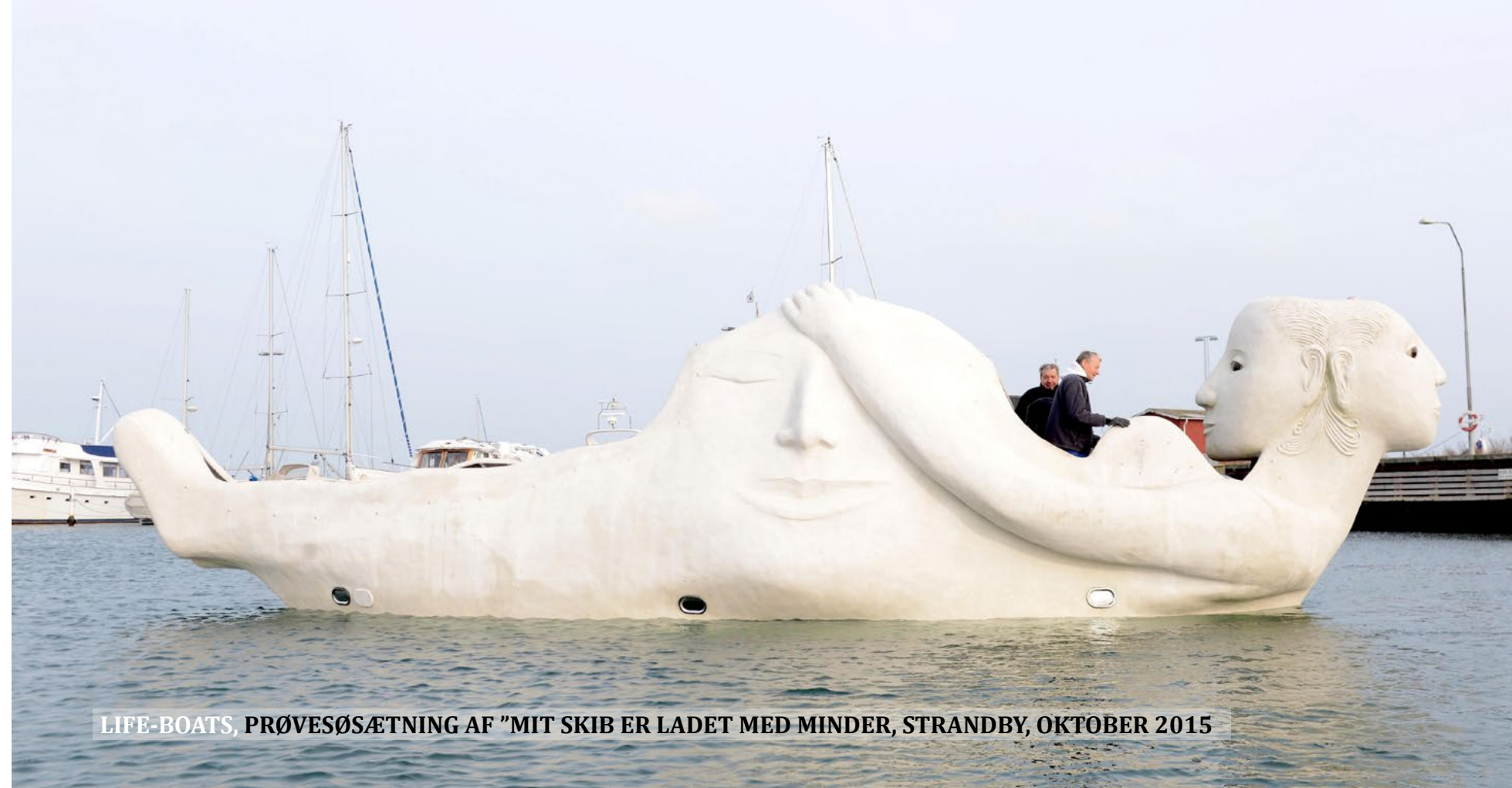
LIFE-BOATS, PRØVESØSÆTNING AF "MIT SKIB ER LADET MED MINDER, STRANDBY, OKTOBER 2015