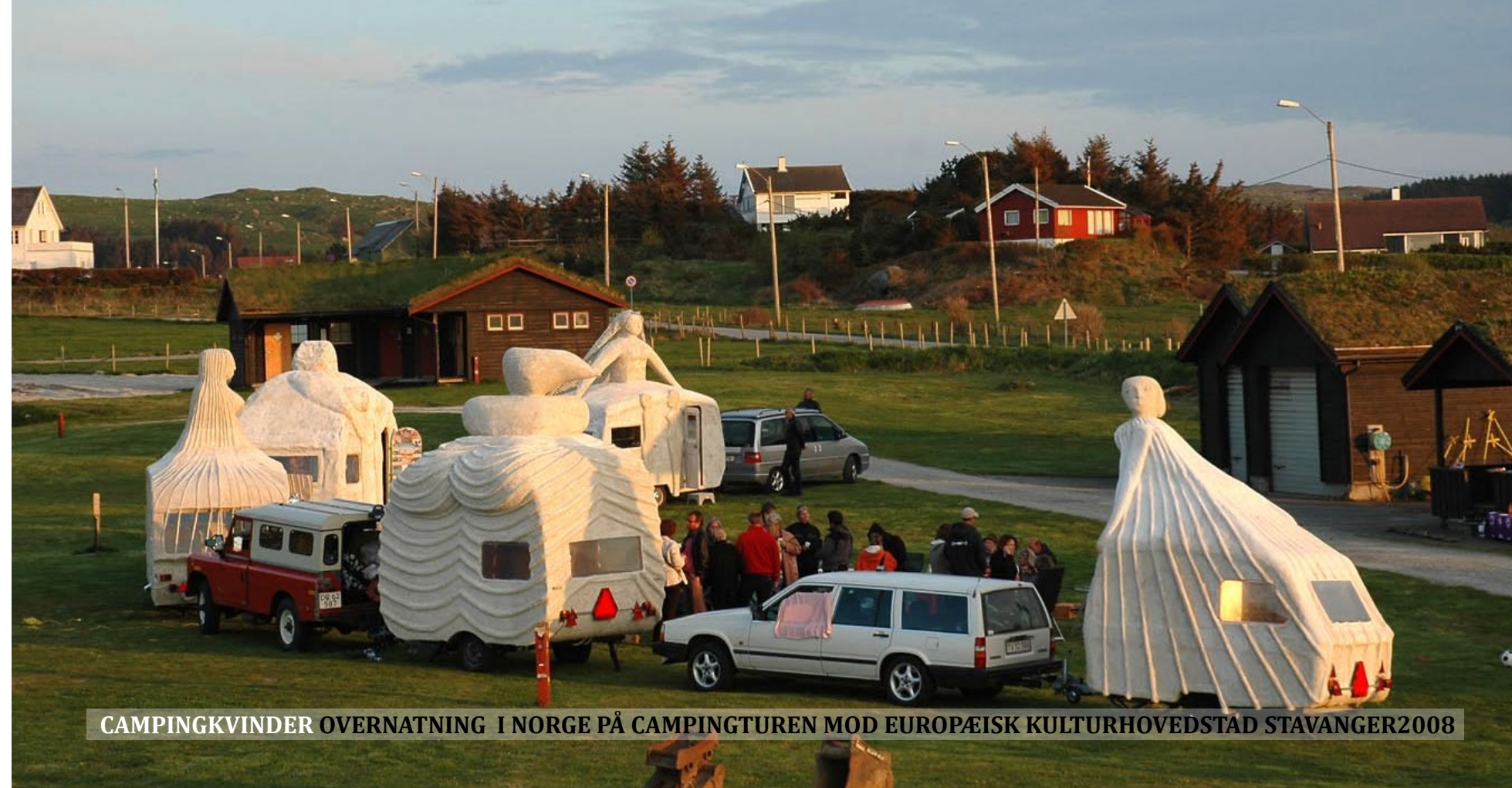
CAMPINGKVINDER OVERNATNING I NORGE PÅ CAMPINGTUREN MOD EUROPÆISK KULTURHOVEDSTAD STAVANGER 2008

Når Campingkvinderne kommer kørende, inddrager de beskueren på en meget aktiv måde. De kører gennem byerne og ude i landskabet, både i Danmark, Island og Norge og bliver mødt med overraskende blikke, begejstrede udråb, måben og utallige andre reaktioner. Gennem disse Kvinder på hjul skabes der et nyt oplevelses- og formidlingsrum, hvor forskellige former for bevægelse har en central plads. De inspirerer både til fordybelse – som især foregår inde i campingvognene – og til nye oplevelser af bevægelse og forvandling. Nu tilhører de Aalborg Universitet, der bruger dem som kreative læringsrum og forskningsobjekter, i samarbejde over flere afdelinger. De ser værket både som en kunstinstallation og et humanvidenskabeligt eksperimentarium, som gør det muligt at udforske erfaringsprocesser.